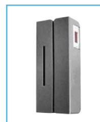
Lector de Tarjeta y Lector de Huella