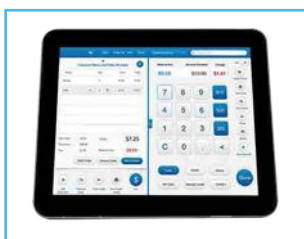
Monitor LCD 9.6"